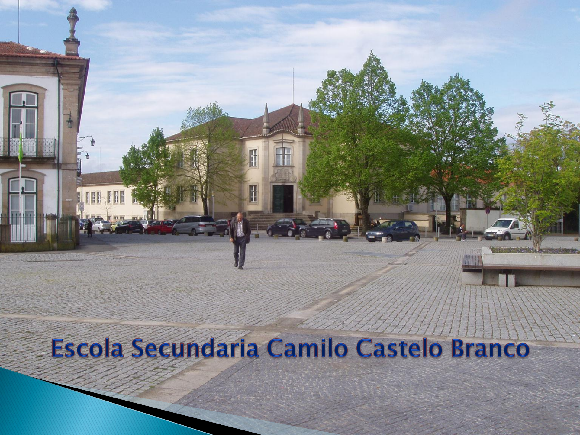
Escola Secundaria Camilo Castelo Branco