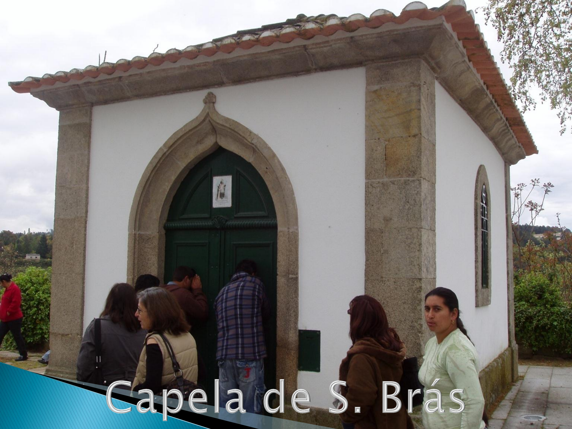
Capela de S. Brás